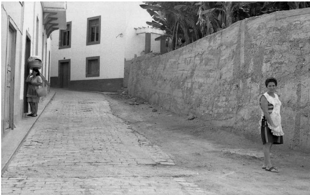
El Callejón Tío Ortega una vez ensanchado en los años 70 del siglo XX