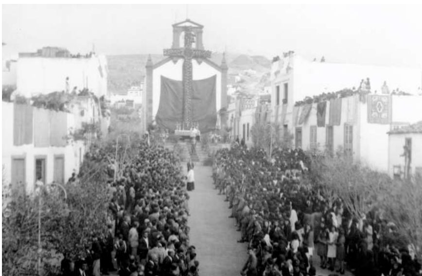
San Roque en los años 40 del siglo XX. A la derecha la primera casa de tejado era de la familia Ortega

En la casa de San Roque vivirá su hija Camila que casó con Francisco Osorio Reyes (platero)