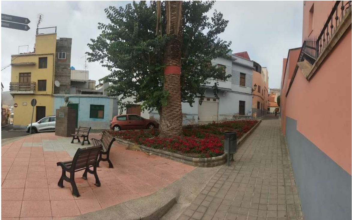
El callejón de Tío Ortega en agosto de 2024.

El casco histórico de la Villa de Guía comienza a formarse en los primeros años del siglo XVI cuando se construyen dos ermitas. La primera bajo la advocación de la Virgen de Guía (hoy parroquia de Santa María de Guía) y la segunda dedicada a San Roque.