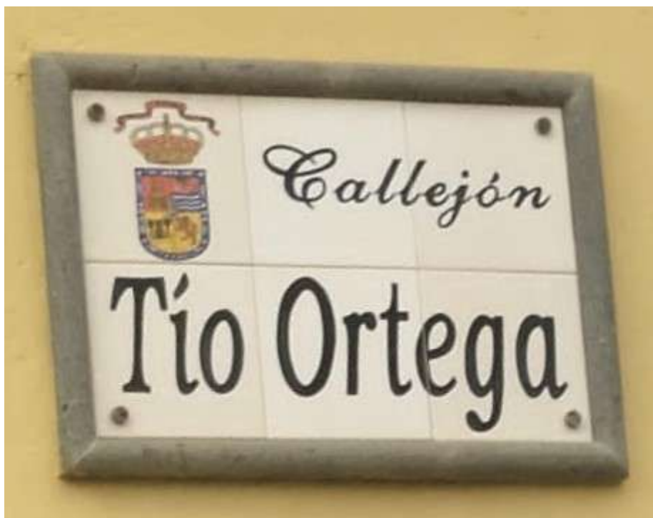
Placa del callejón de Tío Ortega en agosto de 2024.

El hoy denominado "Callejón de Tío Ortega" tiene su origen en un estrecho callejón a tenor de los siguientes datos y no tuvo denominación hasta la primera década del siglo XX como se verá.