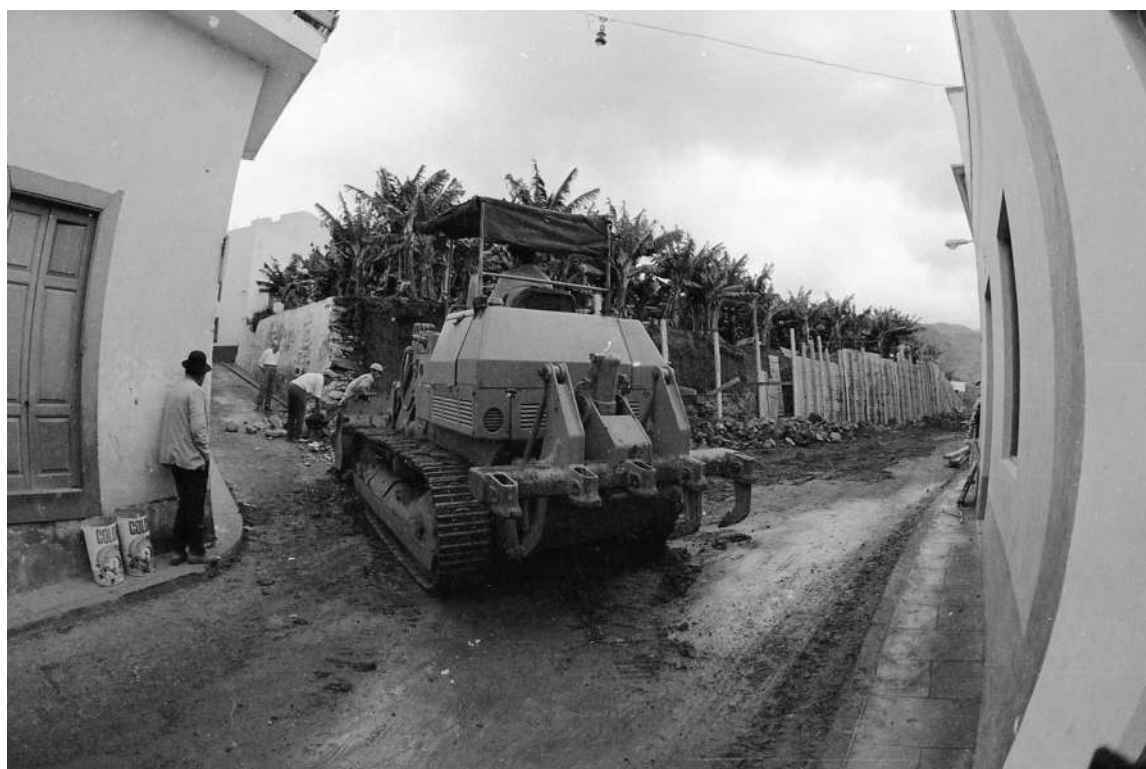
Ensanchando el callejón del Molino y el callejón Tío Ortega en la década de los años 70 del siglo XX