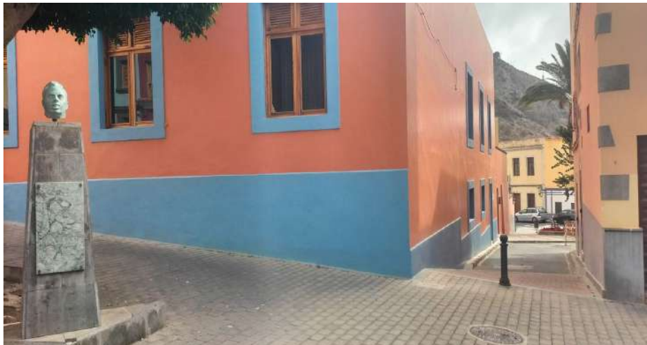
El callejón de Tío Ortega desde la Plaza de San Roque en agosto de 2024.