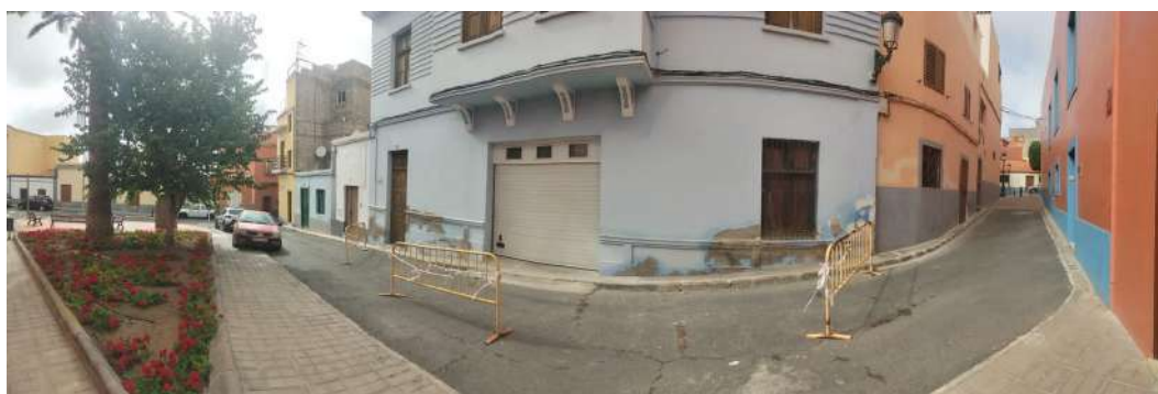
El Callejón de Tío Ortega en agosto de 2024.