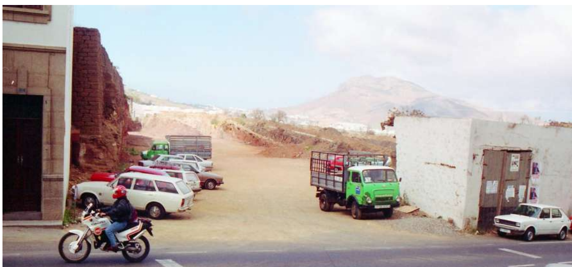
Foto de Paco Rivero en la década de los años 80 del pasado siglo XX (Fundación Canaria Néstor Álamo)