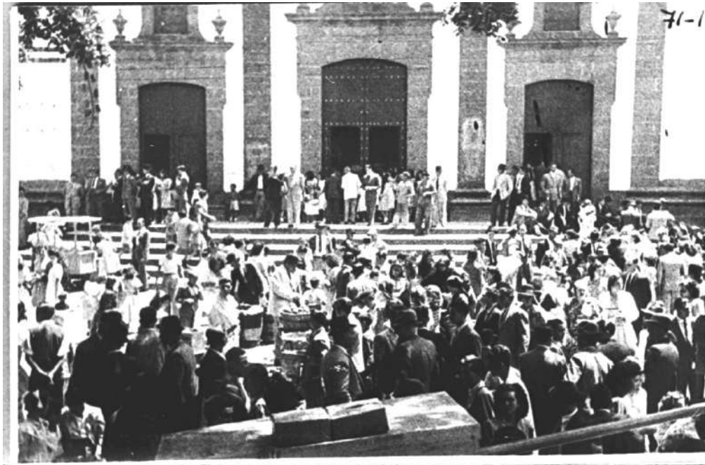
Mercado a finales de los años 50 del siglo XX

El mercado dominical estuvo celebrándose en la Plaza de Guía hasta los primeros años de la década de los años 60 del pasado siglo, en que se construye un mercado o recova, a la vez que se construye un nuevo edificio para ubicar el nuevo Ayuntamiento de Guía.