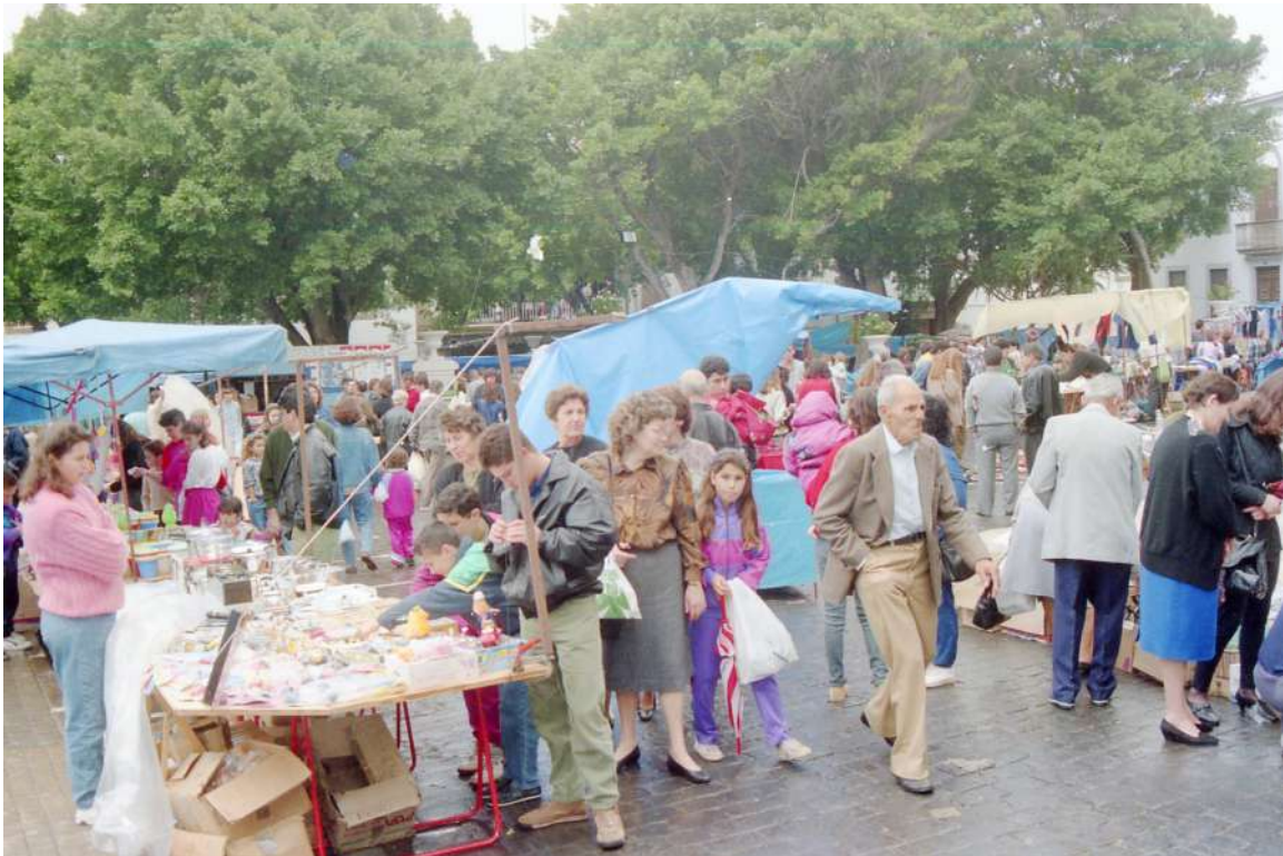
Mercado de Guía década de los años 90 siglo XX