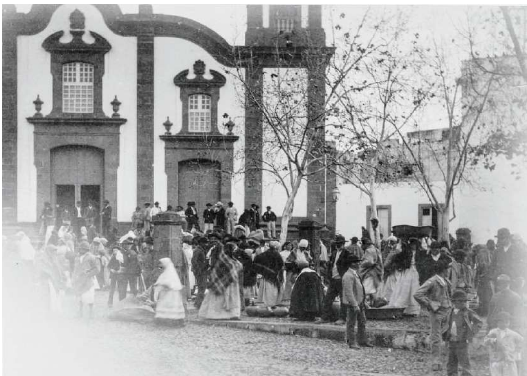
Mercado de Guía a finales del siglo XIX (FEDAC)

A través de los siglos el Mercado de abastecimiento público municipal de Guía, fue consolidándose, llegando a convertirse en el gran mercado de la Comarca Norte de Gran Canaria.