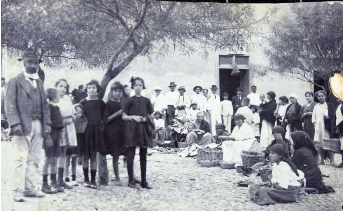
Mercado de Guía en las primeras décadas del siglo XX