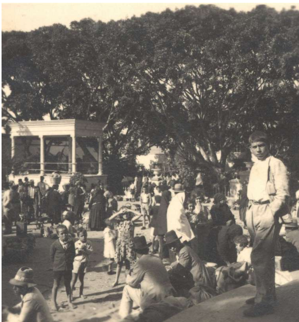
Mercado Dominical de Guía en el año 1935

“El mercado de Guía era colosal para su época, y brillante en su sencillez [...] se extendía el típico mercado guinense por las escalinatas más bajas del templo de Santa María de Guía y en gran parte de la bien empedrada extensión habida entre la bonita iglesia y la plaza[...] además de todo eso tenían abiertas a la par sus puertas comercios numerosos bien surtidos...Será suficiente todo ello para asegurar que tal empuje comercial y el que daba el hecho de ser cabeza de Partido, fue Guía la ciudad importante...Es absolutamente cierto que mucha gente de nuestro pueblo(Gáldar) compraba los domingos en Guía para la semana...Es innegable y justo resulta reconocerlo, que el mercado de Guía era bastante mayor y encima mejor servido. Hasta expendía, curiosamente, aparte de otros productos de las medianías de Gáldar, también el queso magnifico de sus cumbreiros cortijos ...Por lo demás, desde las hierbas medicinales al baifo ...desde el bernegal de Hoya de Pineda al farol de vela..., tenían puesto los tubérculos más preciados, las cebollas más codiciadas y toda suerte de verduras y legumbres...”.