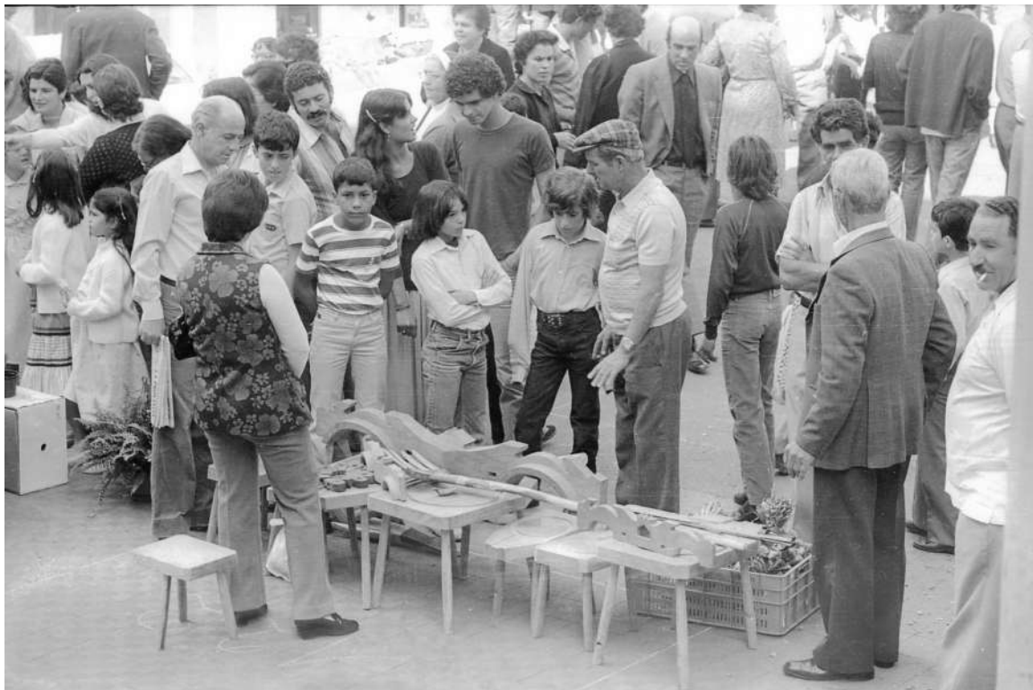
Mercado de Guía en abril de 1981