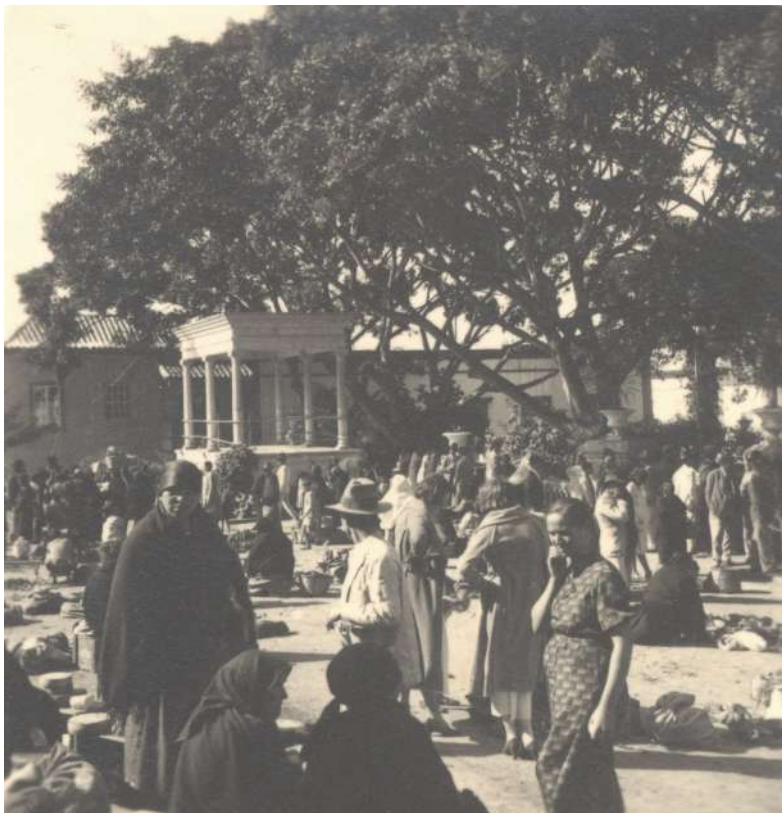
Mercado Dominical de Guía en el año 1935

Gaceta de Madrid 15 de noviembre de 1935