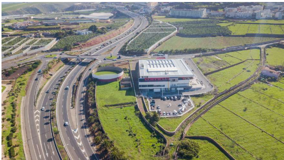
Vista aérea del actual Mercado Agrícola de Guía

En junio de 2008 el Ayuntamiento de Guía comienza a trabajar en la idea de construir un mercado agrícola de ámbito comarcal con el objetivo de que los agricultores y ganaderos de la comarca norte puedan vender sus productos directamente.