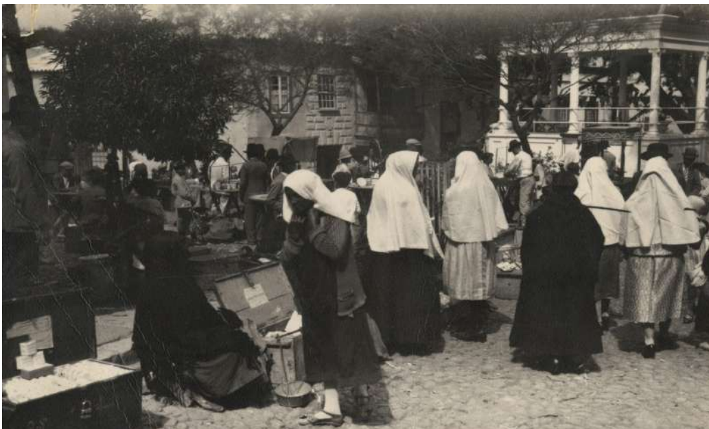
Mercado de Guía en las primeras décadas del siglo XX

Posteriormente el 15 de febrero de 1.903, el Ayuntamiento de Guía acuerda se nombre oficialmente el mercado de Guía, como “Mercadillo Dominical”. Su popularidad a lo largo de las primeras décadas del siglo XX va creciendo, por lo que el Ayuntamiento decide enviar expediente al gobierno de Madrid para que se le conceda autorización ministerial al mismo, y poder así gozar de las compensaciones que preveía la ley.