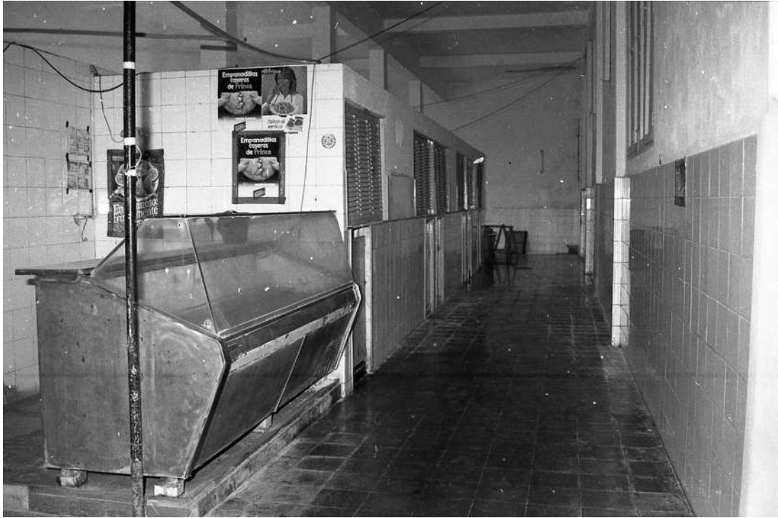
Mercado de Guía. Años 70 siglo XX

A la izquierda la puerta de entrada al mercado o recova de Guía años 60 siglo XX