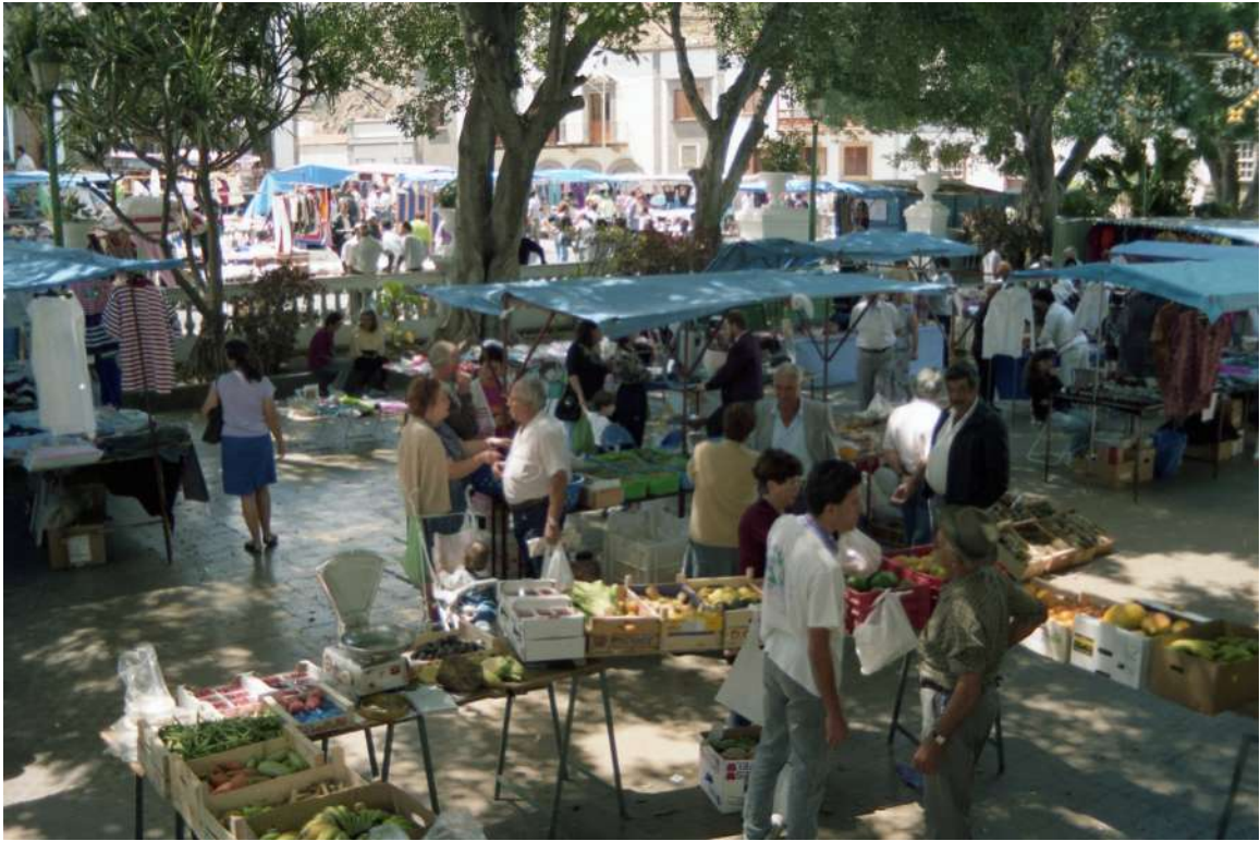
Mercado de Guía década de los años 90 siglo XX