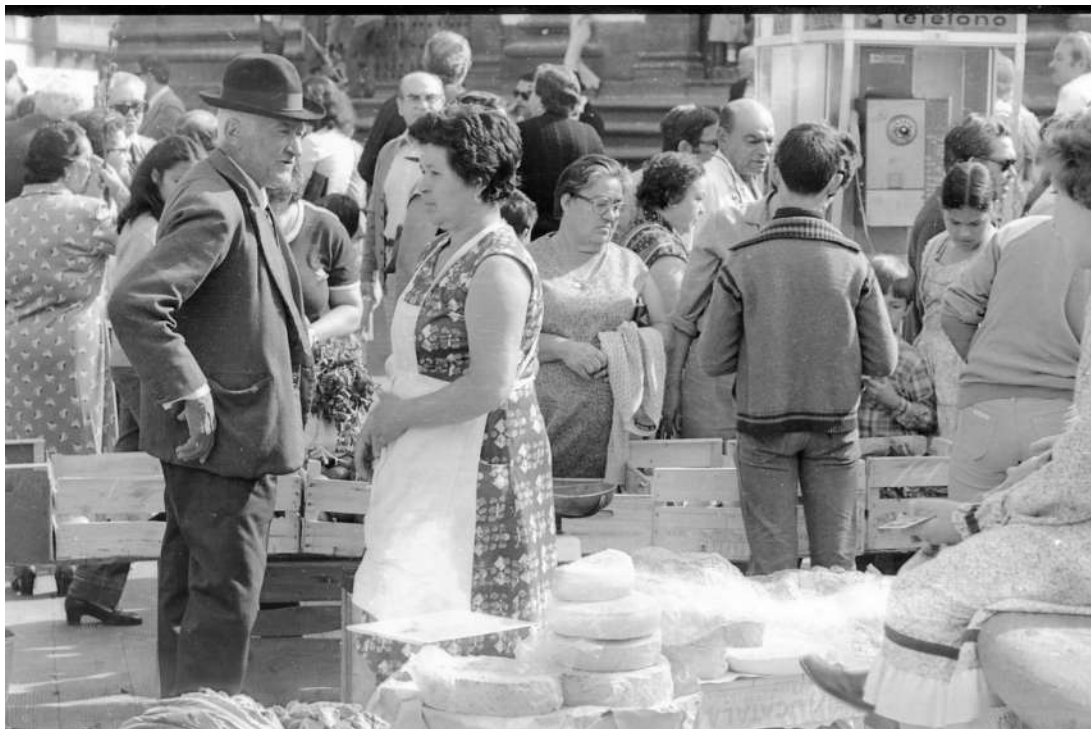
Mercado en 1981