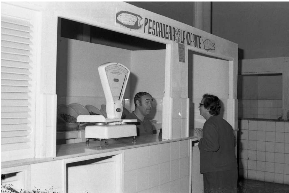
Mercado de Guía. Años 70 siglo XX