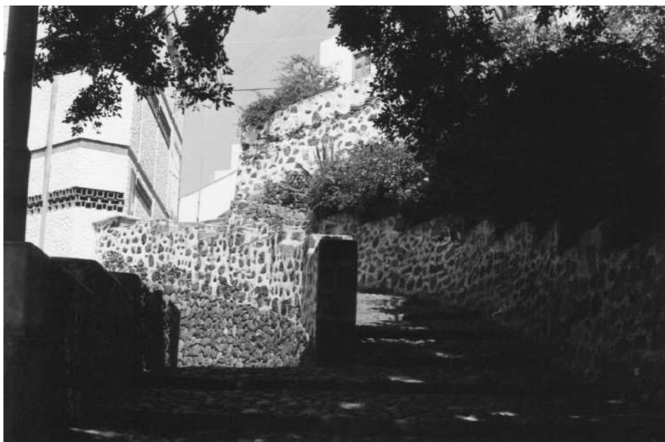
CUESTA DE Los Chorros. OBSERVESE COMO MILAGROSAMENTE SE CONSERVA [A LA IZQUIERDA] LA FAROLA DE TUBO DE CEMENTO CARACTERÍSTICAS DE AGAETE ENTRE 1940-1960

OBSERVESE EL POSTE DE CEMENTO CON FAROLA DE 1954, MUY CARACTERÍSTICO DE LAS ILUMINARIAS EN AGAETE.