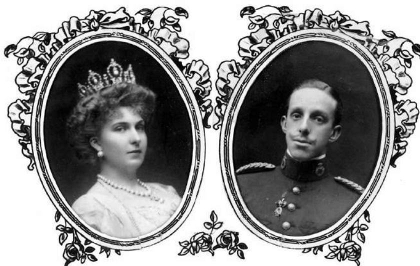
RETRATOS DE LOS REYES DE ESPAÑA ALFONSO XIII Y MARÍA CRISTINA DE HABSBURGO-LORENA NOMBRADOS ALCALDES HONORARIOS DE AGAETE EL 11 DE ENERO DE 1925

Contribuyendo en 1929, siendo Alcalde, junto a numerosos vecinos, con la suscripción que a nivel nacional recaudaba fondos para el homenaje a la reina difunta María Cristina de Habsburgo-Lorena. Significando que la Corporación Municipal siempre se posicionó a favor del trono y de la monarquía, acordando por aclamación en la sesión del 11 de enero de 1925 y a propuesta del Alcalde José Sosa Rosario, nombrar al Rey y a la Reina Alcaldes Honorarios, en desagravio a las manifestaciones que fuera de España se habían levantado en contra Alfonso XIII.