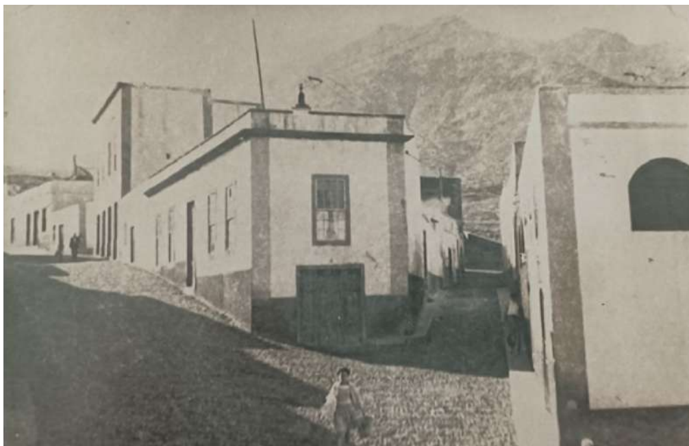
CALLE PRINCESA GUAYARMINA Y CALLE LAGO, LUGARES DONDE RESIDIERON MÉDICOS, FARMACÉUTICOS, MAESTROS Y LATONEROS. FOTOGRAFÍA DE AUTOR NO CONOCIDO