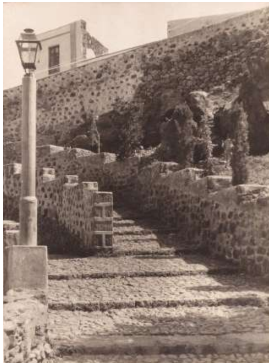
CUESTA DE Los Chorros . ACTUACIONES LLEVADAS A CABO DESDE 1925 A 1955 EN EL CALLEJÓN, EN LA FUENTE PÚBLICA, EL CAMINO, LA PARED DE LA CUESTA, AJARDINAMIENTO, EMPEDRADO E INSTALACIÓN ELECTRICA

OBSERVESE EL POSTE DE CEMENTO CON FAROLA DE 1954, MUY CARACTERÍSTICO DE LAS ILUMINARIAS EN AGAETE.