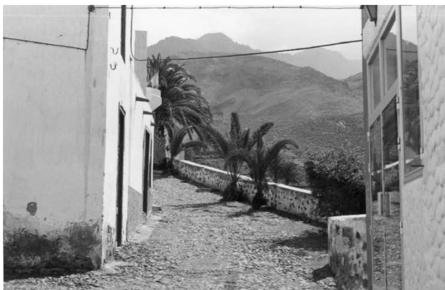
CALLE LAGO. A LA IZQUIERDA EL HABITÁCULO DONDE ESTUVO LA LATONERÍA JOSÉ SOSA RODRÍGUEZ, CONOCIDO POR URDELO , ACTIVO ENTRE LOS AÑOS DE 1945 Y 1960. EN AGAETE TENEMOS CENSADOS «DIECISIETE» LATONEROS ENTRE 1883 Y 1960 FOTOGRAFÍA DE ANTONIO J. CRUZ Y SAAVEDRA, 1979