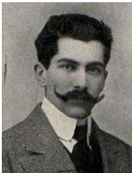
RAFAEL GUERRA DEL RÍO (1885-1955). DIPUTADO A CORTES POR CANARIAS Y MINISTRO DE OBRAS PÚBLICAS. VISITÓ AGAETE EN NOVIEMBRE DE 1933