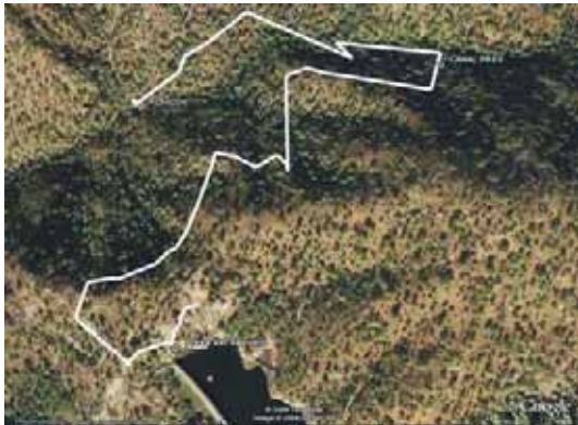
Ortofoto tramo 3