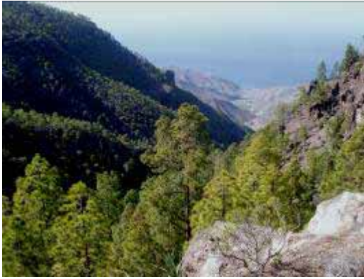
Barranco de Pino Gacho, con El Risco al fondo desde la Presa del Vaquero