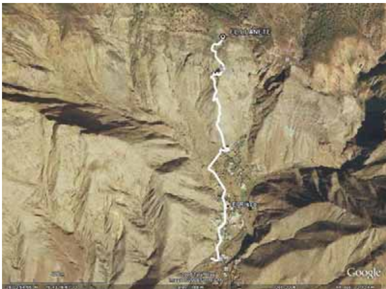
Ortofoto tramo 5

Al llegar al estanque a la derecha seguimos la carretera hasta llegar al lugar donde comenzamos.