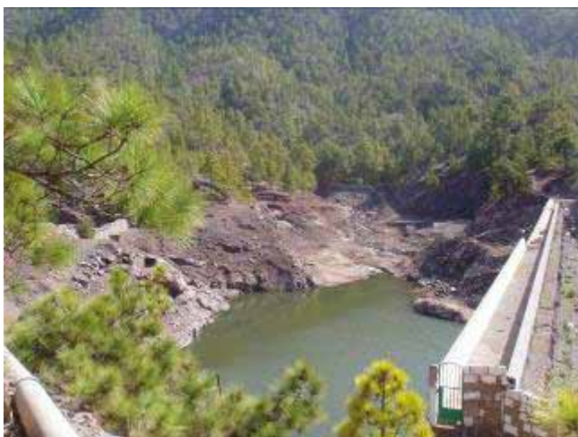
Presa del Vaquero, de titularidad pública, gestionada por el Consejo Insular de Aguas del Cabildo de Gran Canaria. Capacidad: 364000 m 3

La presa del Vaquero, aunque lleve el nombre del barranco, no se encuentra en él, por tanto no recoge sus aguas. La presa recoge las escorrentías del Barranco de Pino Gacho, barranco largo y escarpado que nace en Altavista y desemboca en el del Risco.