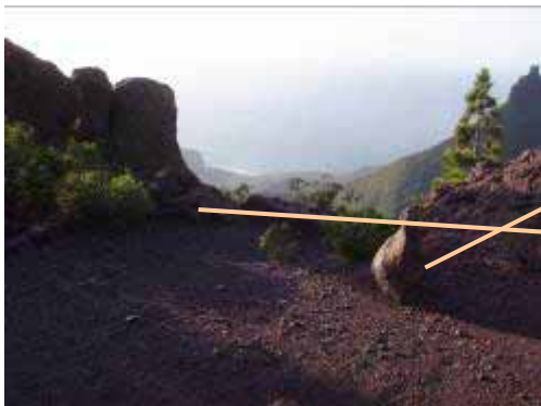
Mojones que nos marcan el comienzo de la bajada

Desde el Arco del Llanete, a unos tres metros hacia la izquierda (Sur), encontramos el comienzo de la bajada, esta muy bien señalizada con dos grandes mojones, parece que nos vamos a tirar al vacío, ni mucho menos, es tan fácil como seguir los pasos que nos marcan los mojones, sin darnos cuenta el obstáculo será salvado y en El Risco podremos tomarnos un refrigerio para comentar la experiencia con nuestros compañeros de caminata.