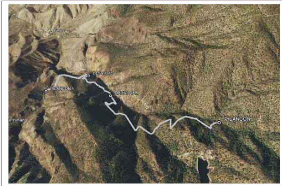
Ortofoto tramo 2.