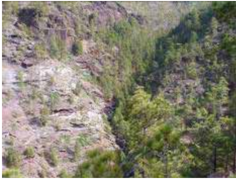
Barranco del Vaquero, típico barranco en "V"