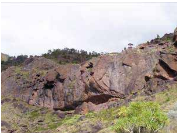
Colada por la que baja el Canalizo.